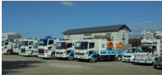
TEC-FORCE*活動のため、 全国から集結した国土交通省の災害対策車両 (令和元年10月、令和元年東日本台風：長野県長野市)

国土交通省北陸地方整備局 Ministry of Land, Infrastructure, Transport and Tourism Hokuriku Regional Development Bureau