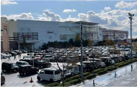
協定締結により災害時に提供する施設例 (イオンモール新潟南：新潟市江南区)