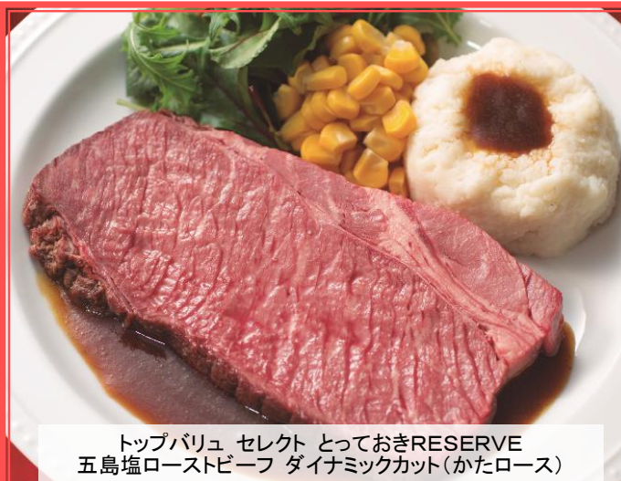
トップバリュ セレクト っておきRESERVE 五島塩ローストビーフ ダイナミックカット(かたロース)

イオンは年末やクリスマスと並びお肉料理のニーズの高まる父の日に向けて、6月3日（水）に全国のグループ約1,400店舗にて、近年人気の赤身肉の旨みを堪能いただけるダイナミックカット（厚切り）の「トップバリュ セレクト っておきRESERVE 五島塩ローストビーフ」と「同 ローストポーク」を新発売します。また、副菜にぴったりの「トップバリュ セレクト マッシュポテト」も同日に新発売し、ご家庭で手軽にお楽しみいただける本格的なレストランのメインディッシュをご提案します。