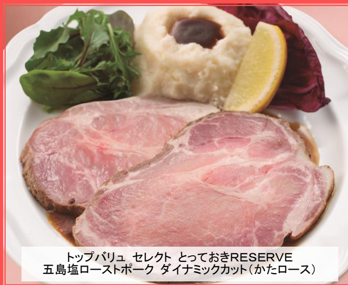
トップバリュ セレクト っておきRESERVE 五島塩ローストポーク ダイナミックカット(かたロース)