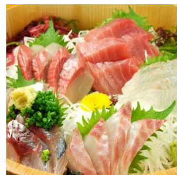
壱岐の郷土料理を堪能！

○申込み URL： http://passmarket.yahoo.co.jp/event/show/detail/01ivpxpteg8.html