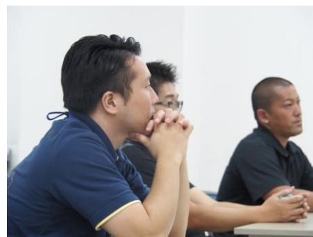
現地男性のワークショップ風景