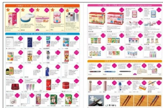
【中国の方向けに化粧品・ヘルスケアを中心に】