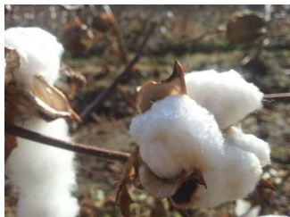
●2016.11 宮城県東松島 収穫祭