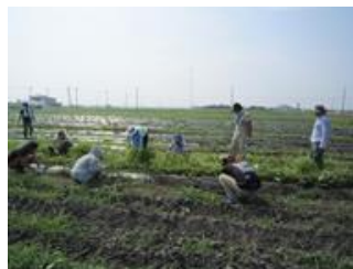
●草取り 使用できる農薬が限られているので、伸びた雑草を手で取り除きます。