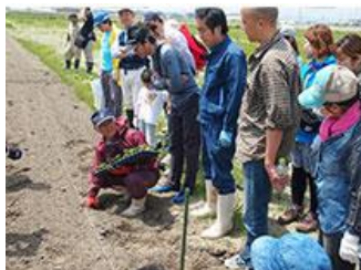
●種まき みんなで協力して植えています。

この日収穫したコットンの一部は、紡績から生地化、商品化を経て、2018年3月に当社店頭にて販売予定です。