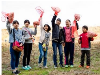
●2015.11 宮城県東松島 収穫祭