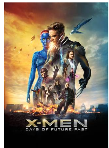
『X-MEN:フューチャー&パスト』 X-MEN: DAYS OF FUTURE PAST

西暦2029年。超高度ネットワーク社会でより高度・凶暴化する犯罪に対抗すべく、政府は草薙素子少佐ら精鋭サイボーグによる非公認の超法規特殊部隊、公安9課=攻殻機動隊を結成した。ある日、彼らに「電腦を自在に操る国際的ハッカー“人形使い”が日本に現われる」という情報が入る。