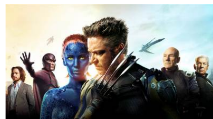
X-MEN: DAYS OF FUTURE PAST © 2014 Twentieth Century Fox Film Corporation. All rights reserved. MARVEL™ & © 2014 MARVEL & Subs.

出演: ヒュー・ジャックマン / ジェームズ・マカヴォイ / マイケル・ファスベンダー 2023年。史上最強のバイオメカニカル・ロボット“センチネル”によって、地球は壊滅へと向かっていた。この危機にプロフェッサーXは宿敵マグニートーと手を組み、危機を根源から絶つため時を越えた1973年にウルヴァリンの“魂”を送り込みセンチネル誕生を阻止させようとするが…。