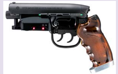
※画像は試作品を撮影したものです。実際の商品と異なる場合がございます。

リドリー・スコットもドゥニ・ヴィルヌーヴも認めた「留之助ブラスター」。ぜひこの機会に手に入れて『ブレードランナー』の世界観に近づいていただくと同時に、ハリソン・フォードが同じものを劇中で使用したということを実感してお楽しみください。