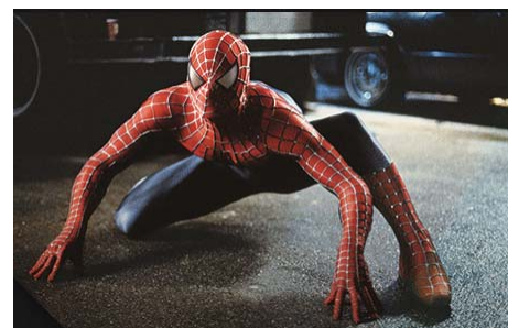
Motion Picture © 2002 Columbia Pictures Industries, Inc. All Rights Reserved. | Spider-Man Character ® & © 2016 Marvel Characters, Inc. All Rights Reserved.