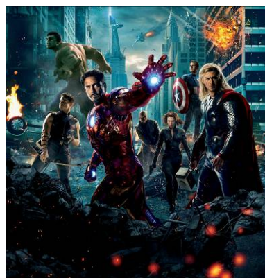
『アベンジャーズ(2012年)』

CS 映画専門チャンネル「ムービープラス」(ジュピターエンタテインメント株)、東京都千代田区、代表取締役社長:寺嶋博礼)は、8月から4ヶ月連続企画として特集放送してきたマーベル映画を、11月に8作品まとめて特集します。『アベンジャーズ(2012年)』、『マイティ・ソー/ダーク・ワールド』、『スパイダーマン™』シリーズ全3作品など、人気のマーベル映画を21時間連続放送する「特集:マーベル最強ヒーロー大集合!」を、11月23日(水・祝)7:30から実施。さらに11月7日(月)~12日(土)には、吹替版を連日放送します。