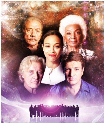
John Durrant/BDH ©BBC 2013