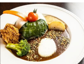
那須産ミルクブレンド オリジナルカレー