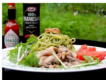
夏限定 バジルと胡桃の冷製パスタ