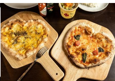
栃木県産小麦使用のハート型ピザ