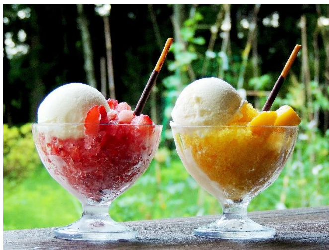
かき氷 那須産ミルク使用のジェラート付