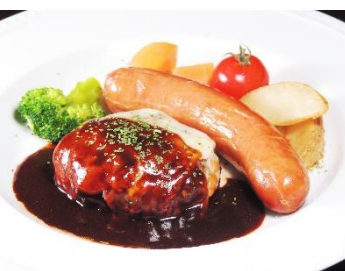
那須高原和牛ハンバーグ プルト付