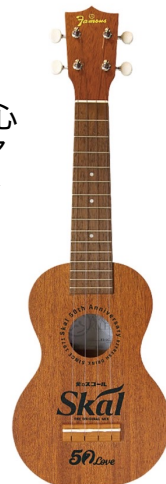
オリジナルウクレレ