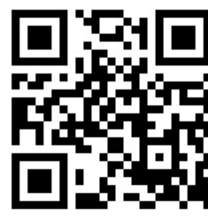
藤原さくら Official Site