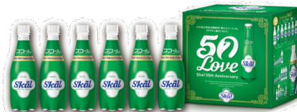
クラシックボトル6本セット ※非売品

名称 : 炭酸飲料 内容量 : 410ml 保存方法 : 常温保存 原材料名 : 砂糖 (国内製造)、乳等を主要原料とする食品、蜂蜜/炭酸、酸味料、香料 値段 : 非売品