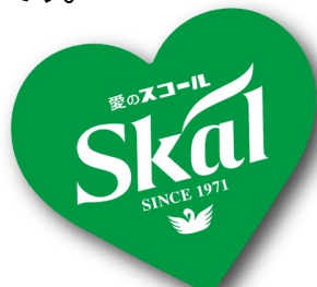
オリジナルピック