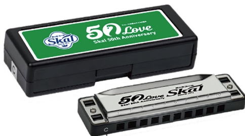
オリジナルハーモニカ