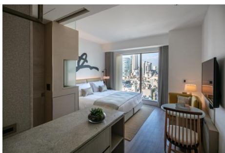
必要な機能がそろった客室 Studio (25㎡)