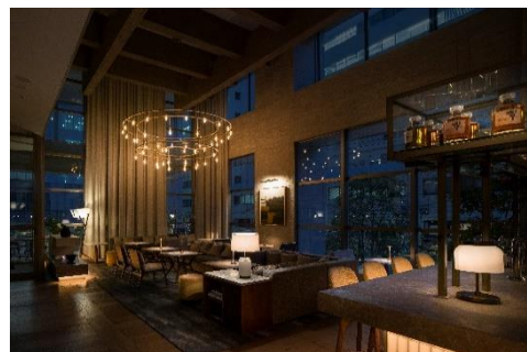
UPSTAIRZ Lounge, Bar, Restaurant

東京・中目黒「CRAFTALE」のエグゼクティブシェフ・大土橋 真也氏がプロデュースを行う同店にて、大阪の食文化に敬意を払い、五感に響く料理の数々をご提供いたします。