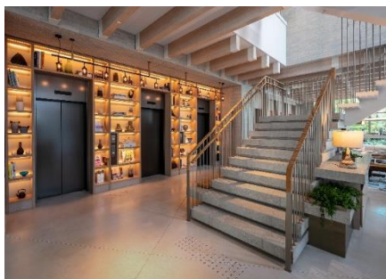
ロビー 正面には2階へ続く階段