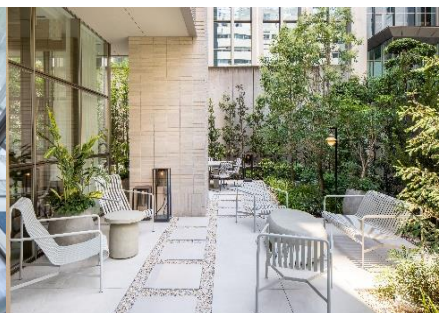
緑に囲まれた1Fのガーデン