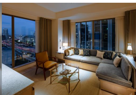
大阪の街が一望できる Suite (57㎡)