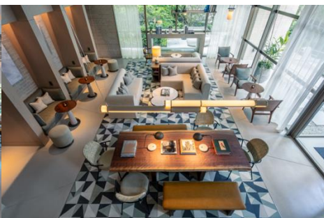
ゆったりとしたゲストラウンジ