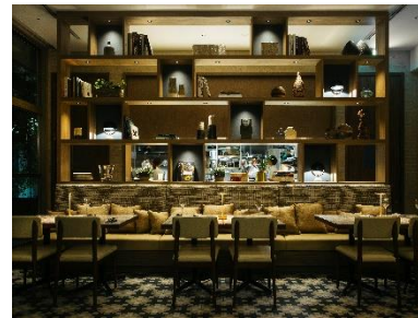
UPSTAIRZ Lounge, Bar, Restaurant