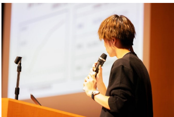
▲第1回高専起業家サミットでのピッチの様子