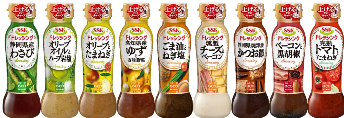
家庭用の「SSKドレッシング(バラエティフレーバー)160ml」全 9 品