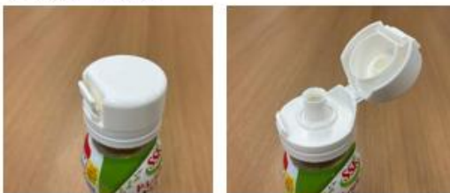
〈ポンカチキャップ〉