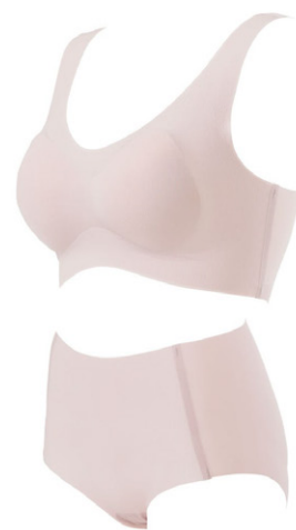
スモーキーピンク