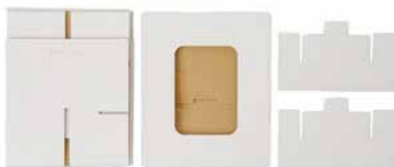
組立式トイレボックス×1個