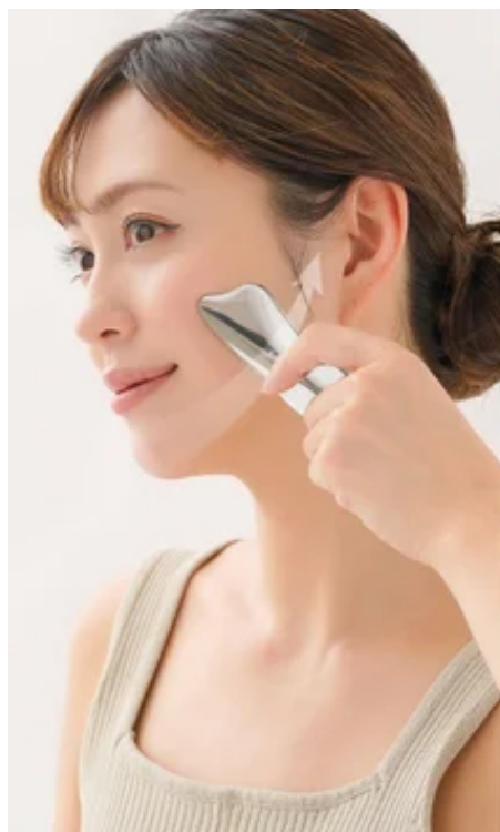
ストレートライン