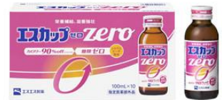
エスカップゼロ (販売名:エスカップ・S)

エスカップ: ビタミン B1・B2・B6、タウリン配合 希望小売価格: 税込 157 円(税抜 146 円)