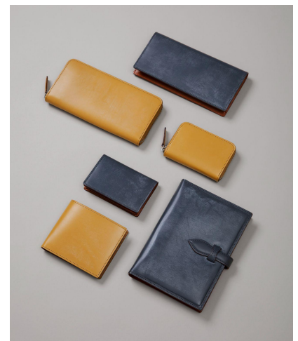
▲秋冬限定カラー「グレー」「イエロータン」

コーディネートアクセントになる「クラッチバッグ」は、休日のお伴からフォーマルシーンまで活躍します。