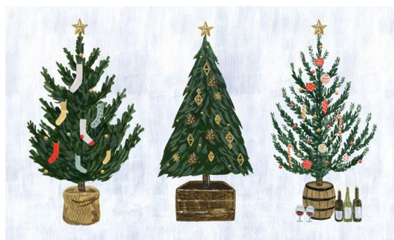
グリーティングカードは、言葉に合わせて様々なツリーが出来る