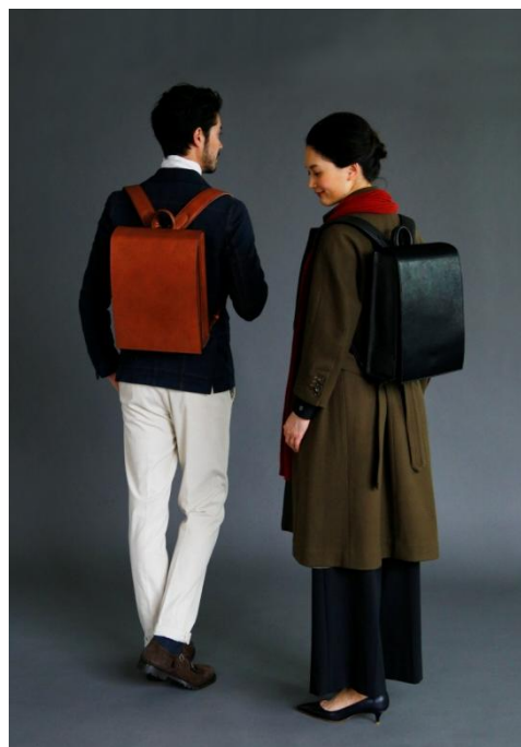
左から、OTONA RANDSEL 001(ブラウン)、002(ブラック)