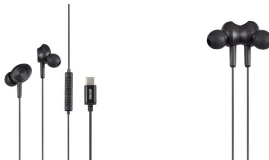
マイク搭載 USB Type-C™コネクター対応カナル型ヘッドホン「MXH-CC200」

マクセル株式会社(取締役社長: 中村啓次/以下、マクセル)は、マイク搭載 USB Type-C™コネクター対応カナル型ヘッドホン「MXH-CC200」を6月12日より発売します。USB Type-C™端子が搭載されたPCやスマートフォン、タブレットなど、さまざまなデジタル機器に対応する有線タイプの高音質ヘッドホンです。