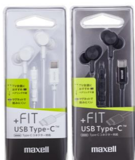
ホワイト(左)、ブラック(右)

耳にぴったりフィットする、マイク搭載 USB Type-C™コネクター対応カナル型ヘッドホン