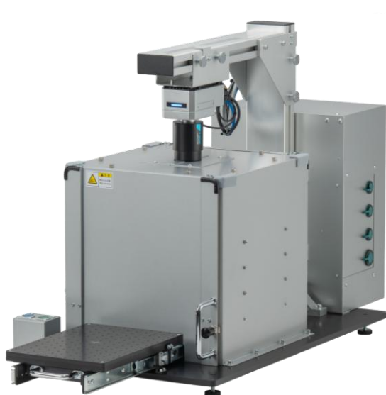
手動スライドテーブルモデル(小・大)