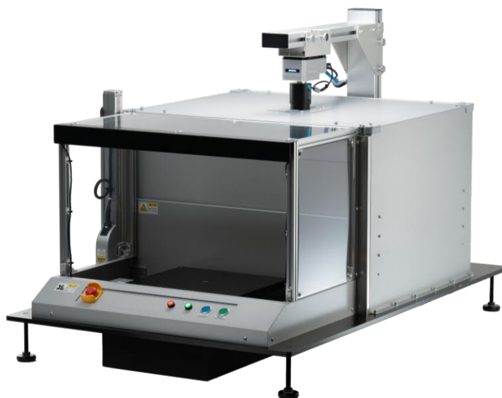
自動 XY ステージモデル