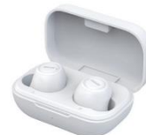
完全ワイヤレスカナル型ヘッドホン「MXH-BTW300」

マクセル株式会社(取締役社長:中村啓次/以下、マクセル)は、Bluetooth®対応の完全ワイヤレスカナル型ヘッドホン「MXH-BTW300」を10月25日より発売します。シーンを選ばず使えるシンプルなデザインで、はじめての完全ワイヤレスヘッドホンにもおすすめです。