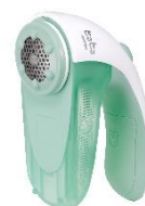
KC-NB222-G (フレッシュグリーン)