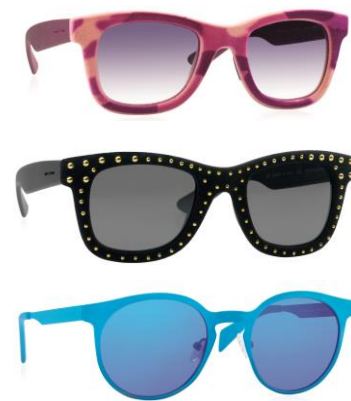
(POP-UP SHOP で発売されるサングラス例)

2013年春、日本国内での取り扱いを開始した「Italia Independent(イタリア インディペンデント)」は、ファッションistaとして有名なラポ・エルカーンが創設したブランドです。ライフスタイル全般に渡り、ユニークかつスタイリッシュな世界観で、時代や世代を超えた製品を、イタリアらしい遊び心あるデザインで生み出していることが特徴で、カール・ラガーフェルドを始めとするファッションistaや、プロスポーツ選手、レディー・ガガやミランダ・カーなど多くのセレブリティに愛用されています。