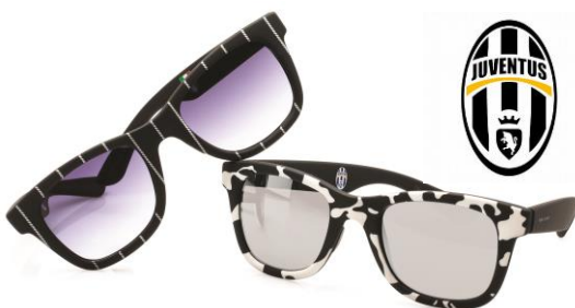
(「I-TRIBUTE TO JUVENTUS」2013モデル)

今年、世界最高峰のプロサッカーリーグ、イタリアセリエ A で2連覇を果たしたユヴェントスの優勝記念モデル 2013年版(2モデル*1)を発売いたします。