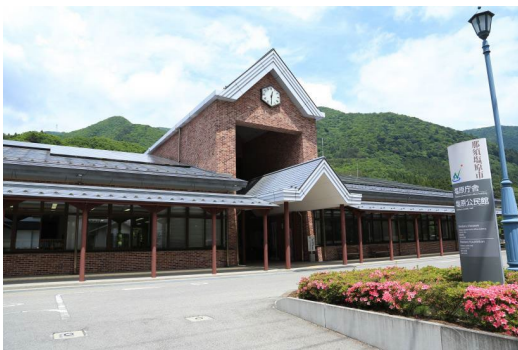
那須塩原市役所 塩原支所