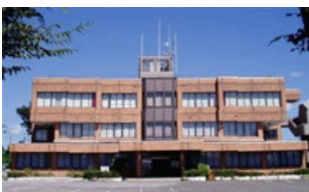
黒磯保健センター