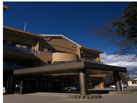
黒磯公民館（いきいきふれあいセンター）