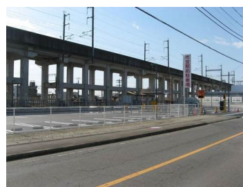
西那須野駅前駐車場