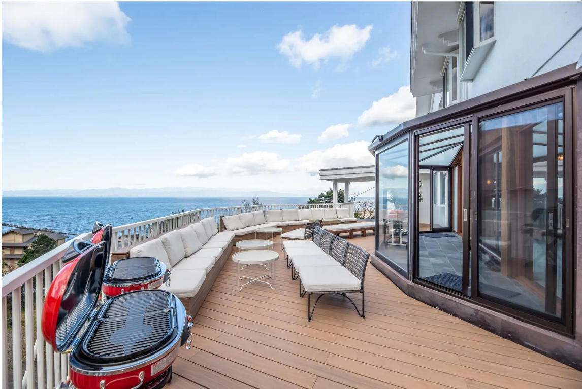
SUNSET OCEAN VIEW VACATION VILLA BLUE LAGOON