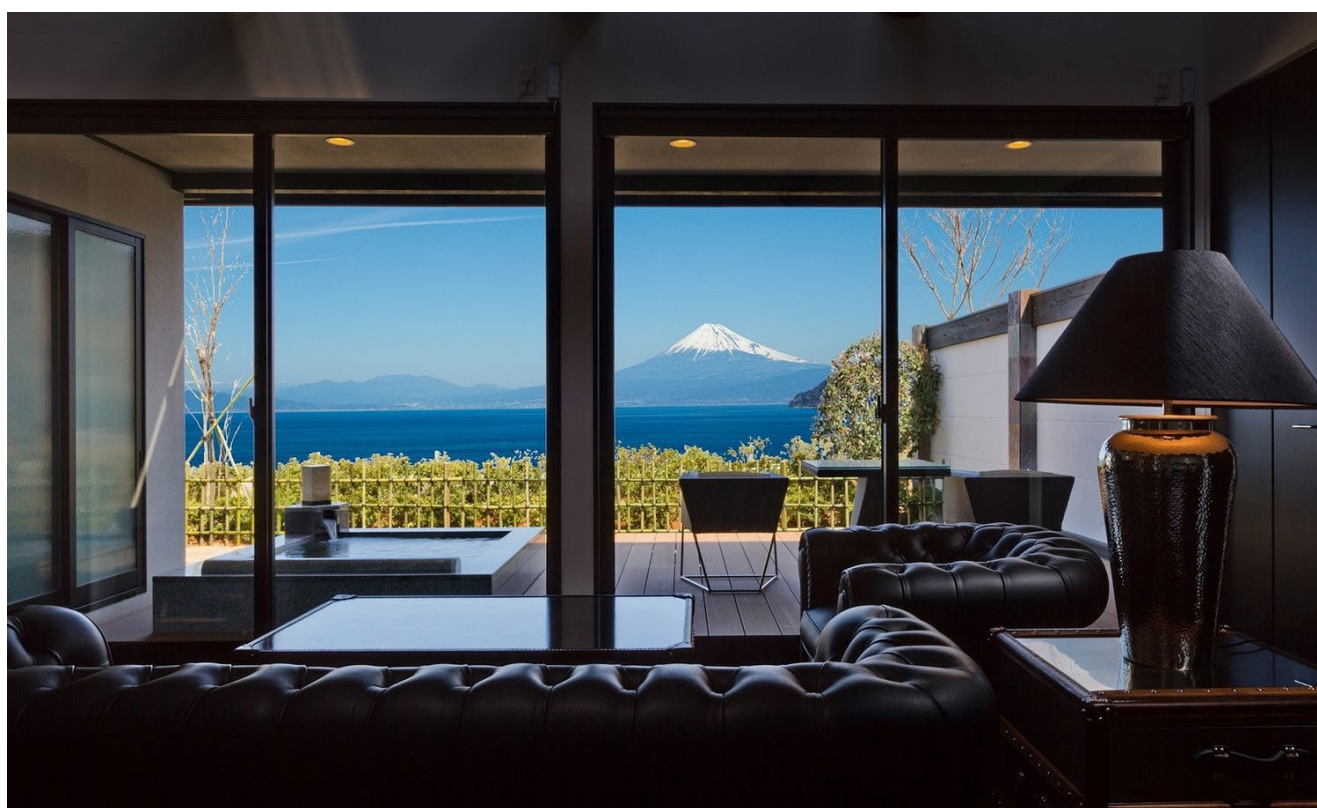
世界遺産 富士山を望む宿 富岳群青