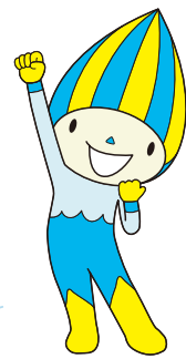
「清流の国ぎふ」 マスコットキャラクター ミナモ