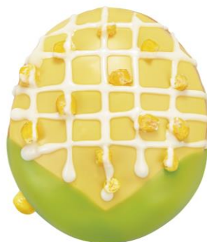
『北海道プレミアム とうきび クリーム』

『クリスピー・クリーム・ドーナツ 札幌ル・トロワ店』が出店する「ル・トロワ」は、「キレイ、ステキ、オイシイ」の3つのシアワセが叶う、「美と健康」をコンセプトにした大型商業施設です。札幌市営地下鉄大通駅直結と好立地にあり、アクセスしやすくなっています。多くの人が行き交う立地にオープンする同店は、お気軽にドーナツをお楽しみいただけるテイクアウト店舗となっています。