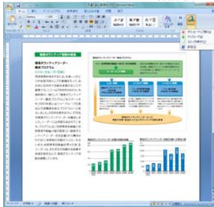
「quarp Add-in for Microsoft® Office 2003/2007」 操作画面イメージ(2007版)