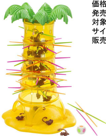
バナナの木を模したツリー型のタワー

サイコロを順番に振りスティックを抜いていき、全30本のスティックを抜き終わった時点で自分が落としたモンキーの数を数え、一番少なかった人が勝者となります。誰でも覚えやすいルールのため、小さいお子様から大人まで幅広い世代に楽しんでいただけます。