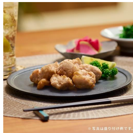
※写真は盛り付け例です。