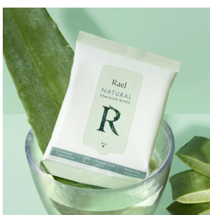
ナチュラルリフレッシュシート RAEL：880円

フィンランド生まれの月経カップ。メーカーのLunetteは、2005年から月経カップをつくり続けています。