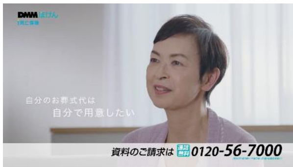
TVCM「私の保険選び 篇」カット