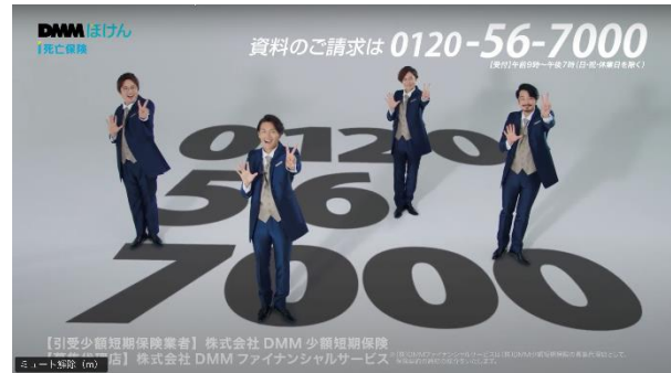
TVCM「DMM ほけんデビュー〈純烈〉 篇」カット