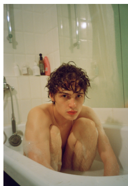
With Love From Russia #16