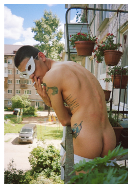
With Love From Russia #13