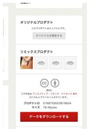
プロダクト・リミックス機能