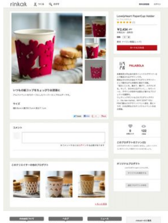
プロダクトイメージ