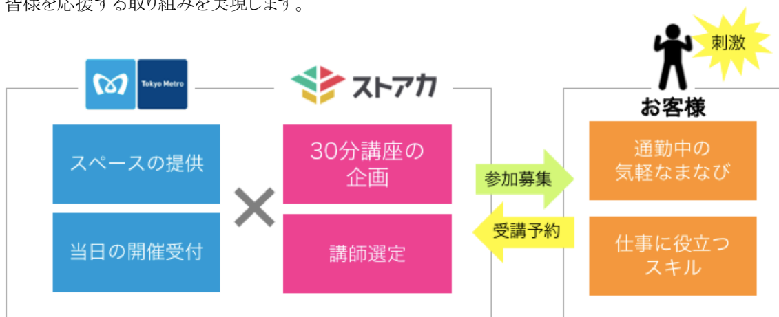
スキーム イメージ図

「30分でまなべる！ビジネスパーソンのためのメロde朝活」は、2017年10月から12月にかけて実施したオープンイノベーションプログラム「Tokyo Metro ACCELERATOR 2017」で最終審査を通過したストアカと東京メトロが共同で実施するものです。ストアカが、講師選定および講座企画を行い、東京メトロが講座運営を行います。両社は、この「Echika fit 永田町」での実証実験を皮切りに、東京メトロ沿線の首都圏および近郊エリアにて順次展開する予定です。ベンチャー企業と鉄道会社の協業により、通勤中のお客様に気軽に学べる場を提供し、新しいことを一歩踏み出す皆様に応援する取り組みを実現します。