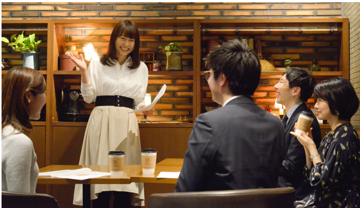
朝活風景イメージ

日本最大級のスキルシェアサービス「ストアカ」を運営するストリートアカデミー株式会社（以下「ストアカ」）と東京地下鉄株式会社（以下「東京メトロ」）は、東京メトロが保有するのスペースを有効活用し、2018年4月18日（水）より、東京メトロ永田町駅構内の駅チカ商業施設「Echika fit 永田町」にて、通勤中のお客様に気軽な学びを提供する講座「30分でまなべる！ビジネスパーソンのためのメロde朝活」を開講します。今後は随時展開エリアを拡大していく予定です。