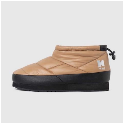
PUFFY MINI / TAN