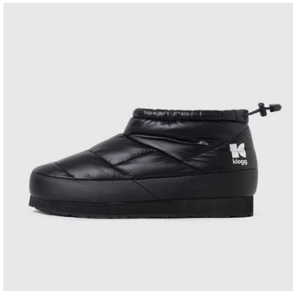
PUFFY MINI / BLACK