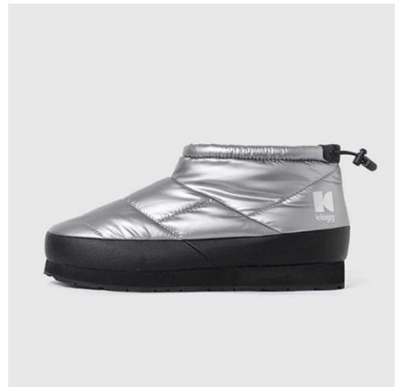
PUFFY MINI / METALLIC SILVER