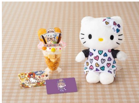
▲各ワークショップ完成イメージ