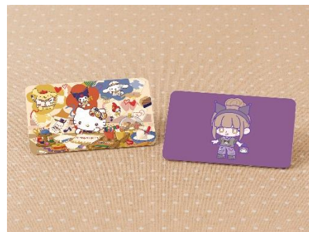
▲キャラクターデザイナー体験イメージ

※画像素材ご掲載の際は、必ずコピーライトの記載をお願いいたします。 © 2025 SANRIO CO., LTD. TOKYO, JAPAN 著作 株式会社サンリオ