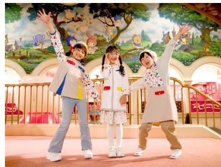
▲お子様のコスチュームイメージ