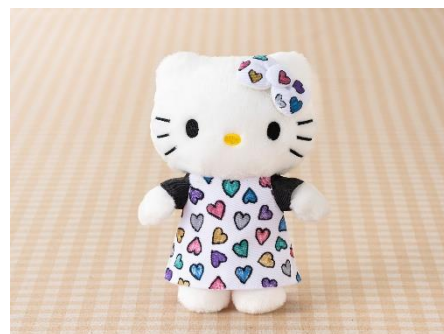
▲衣装デザイナー体験イメージ