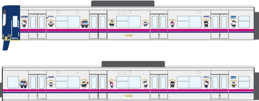
《外装ラッピング(イメージ)》

概 要：京王多摩センター駅の装飾に合わせた濃紺とゴールドの落ち着いた色味を基調とし、正面・側面にはサンリオの人気キャラクターたちが京王電鉄の制服を着用したデザインとなっています。京王多摩センター駅の装飾とあわせてサンリオの世界観をお楽しみいただくことができます。