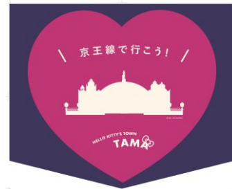
《オリジナルヘッドマーク》