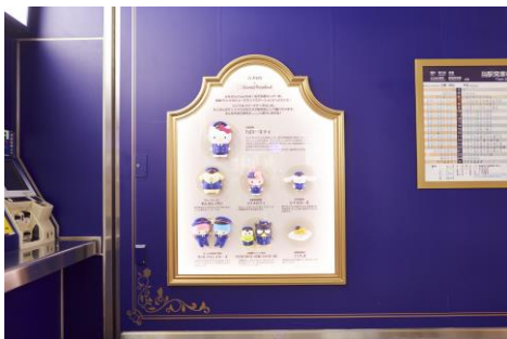
《駅係員紹介スポット》