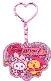
アクリルキーホルダー (全7種) 各880円