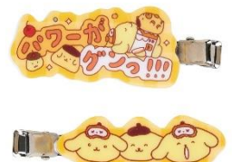
アクリルヘアクリップ (全7種) 各990円