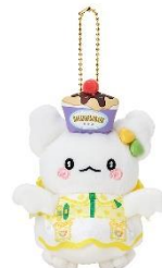
マスコット (全7種) 各2,750円