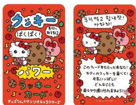
ラッキーカード (全7種) 各220円

チエゴシムの特徴である「ラッキーカード」やアクリルキーホルダー、持ち歩いて癒されるアイテムが多数登場！また、ライブキャラクターとお揃い衣装の期間限定のマスコットも登場します。