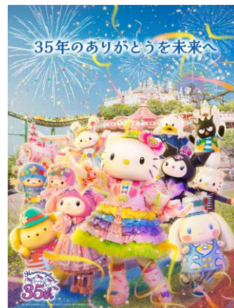
▲Harmonyland 35th Anniversary