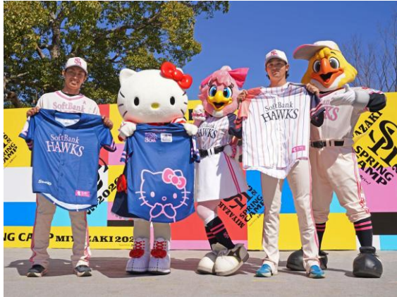
▲宮崎で実施されたユニフォーム発表の様子

5月8日（金）は、当日の観戦チケットをお持ちの方を対象に、「ハローキティ ピンクフル限定ユニフォーム」が配布されました。本ユニフォームは、2月21日（土）に福岡ソフトバンクホークスのキャンプ地である宮崎市生目の杜運動公園の特設ステージにハローキティが登場し、お披露目されたものです。テーマカラーのピンクとは対照的なダークネイビーのユニフォームは、老若男女を問わずどなたでも着用しやすいデザインとなっており、来場者が着用することで会場全体に大きな一体感が生まれ、ピンクフルデーならではの華やかな光景が広がりました。