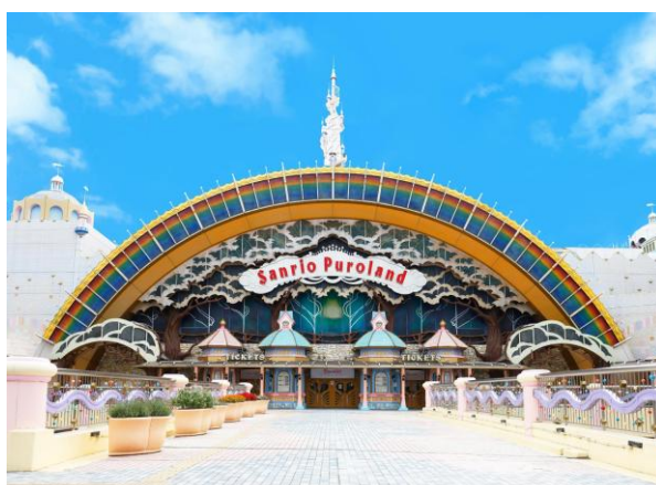
▲サンリオピューロランド

両パークでは、オープン開園35周年を記念したアニバーサリーイベントを実施しており、それぞれのテーマパークならではの特別なコンテンツを展開しています。