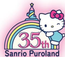
▲Sanrio Puroland 35th Anniversary

※画像素材ご掲載の際は、必ずコピーライトの記載をお願いいたします。 © 2026 SANRIO CO., LTD. TOKYO, JAPAN 著作 株式会社サンリオ © SoftBank HAWKS