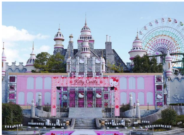
▲サンリオキャラクターパーク ハーモニーランド

日本に二カ所しかないサンリオのテーマパーク「サンリオキャラクターパーク ハーモニーランド」と「サンリオピューロランド」。ハーモニーランドは大分県日出町にある屋外型のテーマパーク、ピューロランドは東京都多摩市にある屋内型のテーマパークです。サンリオキャラクターによるライブショーやアトラクション、グリーティングなど、子どもから大人まで楽しめるコンテンツを展開しています。