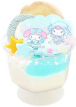
マイメロディ&クロミの ミルクプリンパフェ 950円