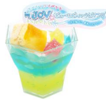
≡JOYスペシャルスイーツ 独り占めかな？ ブルーハワイレモン♡ゼリーパルフェ 1,000円