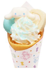
シナモロールのキラキラ☆ はちみつロールクレープ 1,000円