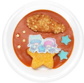
リトルツインスターズのかりかり☆ささみ フライのバターチキンカレー 1,600円

また、≡JOYの楽曲をイメージしたスイーツも登場し、ここでしか味わえない特別感あふれるメニューとして注目を集めました。