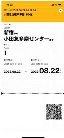
チケット券面（イメージ）

チケット券面に表示されるQRコードを小田急線の有人改札口とサンリオピューロランド入場口でそれぞれ専用端末にかざすことで、スマートフォン1つでご利用いただけます。代表者のEMotアカウントでチケットを複数購入して他の方のEMotアカウントに1枚ずつ譲渡できるので、ご家族分のチケットをまとめて購入いただけます。なお、ご利用には一人1台スマートフォンが必要です。