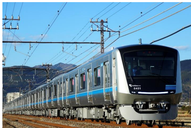
小田急の通勤車両 5000形

このチケットは、混雑日など施設の指定日を除き、小田急電鉄が運営するMaaSアプリ「EMot」とデジタルチケット購入サイト「EMotオンラインチケット」にて販売するオンライン限定商品です。「おとな」「中高生」「こども」「シニア」の4区分をご用意し、往復分の乗車券と施設のデイパスポートを個別に購入いただくよりも、お得にお買い求めいただける価格設定としています※2。