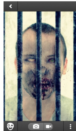
スクリーンショット