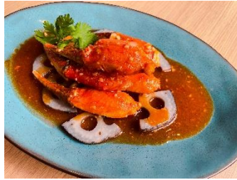
チリ・クラブ 3,980円 (税込)

蟹を贅沢に使った、クリスマスにぴったりの贅沢な逸品。ぷりぷりとした身にチリソースが絡まって食べ応えがあります。