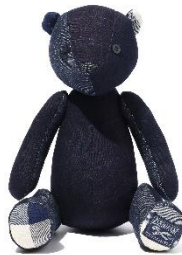
TOY BEAR 7,700円 (税込)

様々なデニム素材を組み合わせで作られた、クリスマス限定のくまのぬいぐるみを販売。