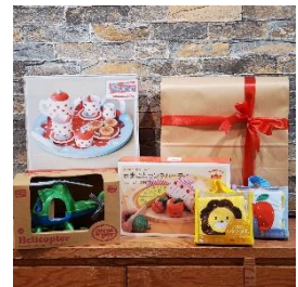
キッズアイテム 1,100円 (税込)

ギフトとしても大人気のおもちゃシリーズ。親子でコミュニケーションを取りながら楽しめるおもちゃが今年は数量限定で販売予定。