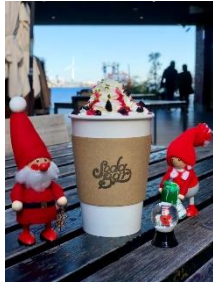
ベリーのホットチョコレート 702円 (税込)

SODABAR HOTドリンク人気NO.1のホットチョコレートに甘酸っぱい自家製ベリーシロップを入れたクリスマス限定のドリンク。