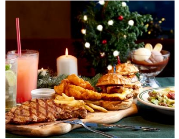
クリスマスフォアグラコース 3,600円 (税込) ※1名料金

クリスマスの時期にしか味わえない、フォアグラを使ったハンバーガーが魅力の贅沢なコース料理。