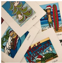
ヘザーブラウン マットプリントアート 4,840円 (税込) ~

大人気アーティスト“Heather Brawn”のホリデーシーズン限定のクリスマスアート。今年は海を感じられるサーフクリスマスがテーマ。