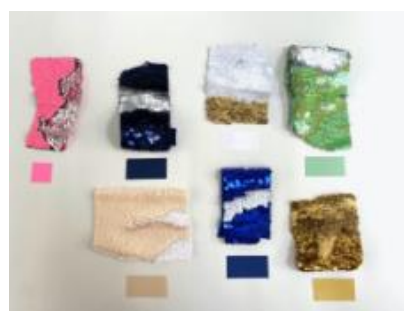
※Lala Schnitger 過去作品