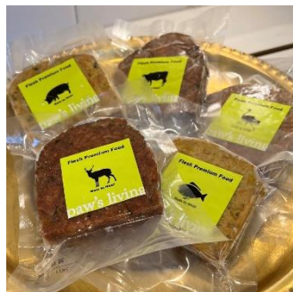
テリーヌ 各種 ¥660 (税込)

100%鹿児島県産にこだわり、完全無添加、無着色で作られた冷凍のウェットフードやトリーツのペット向け試食会を開催いたします。