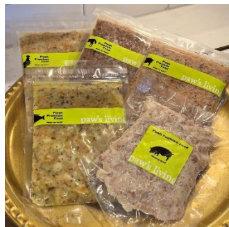
フレッシュフード 各種 ¥660 (税込)