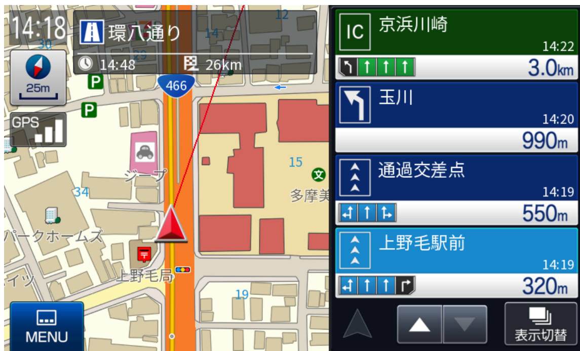
<業務用カーナビ SDK Ver.11.0 ユーザーインターフェース>

※1「業務用カーナビ」は業務アプリ開発者様が利用するカーナビ SDK（ソフトウェア開発キット）パッケージです。専用カーナビ開発キット「業務用カーナビ SDK」 https://mapple.com/products/system-biznavi/