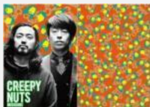
ヒップホップユニット Creepy Nuts (R-指定 & DJ松永)