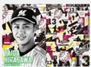
プロ野球選手 平沢 大河