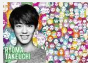
俳優 竹内 涼真