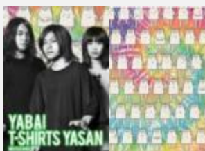
3人組自称メロコアバンド ヤバイTシャツ屋さん