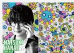
声優 花江 夏樹