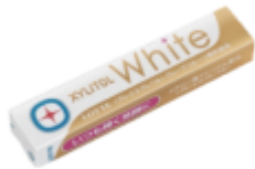
キシリトールホワイト <グレイスグレフル> ファミリーボトル