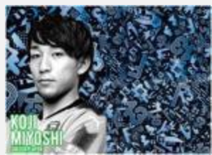
プロサッカー選手 三好 康児