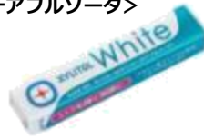
キシリトールホワイト <チアフルソーダ> ファミリーボトル