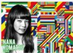
女優・モデル 小松 菜奈