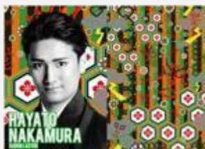
歌舞伎俳優 中村 隼人