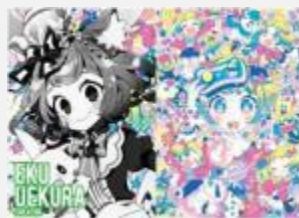
イラストレーター 上倉 エク