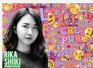
実業家 椎木 里佳