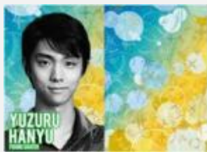
フィギュアスケーター 羽生 結弦

ロッテ「キシリトールガム」と新たな未来をつかっていく若者20組。様々なジャンルから選定した彼らと、新たな可能性に挑戦します。