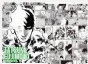
漫画家 ©藤本タツキ/集英社 藤本 タツキ