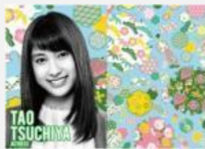
女優 土屋 太鳳