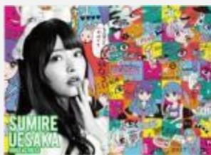
声優 上坂 すみれ